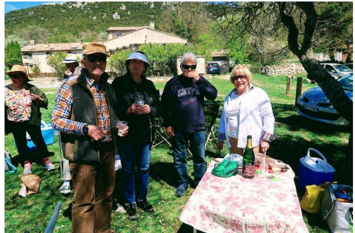
Mise en condition indispensable avant l'effort