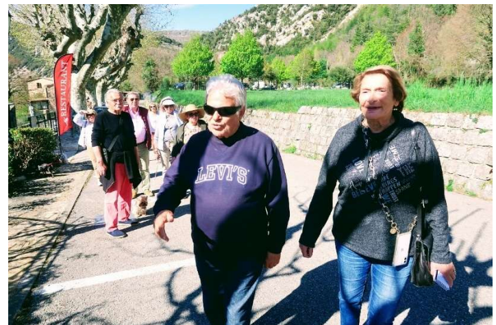
Impossible de reconnaître cette étape !