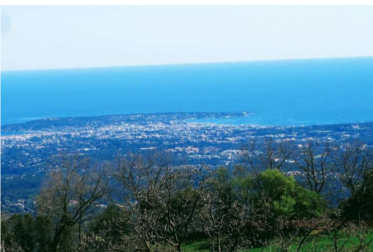
Tout en bas la mer, qui nous appelle