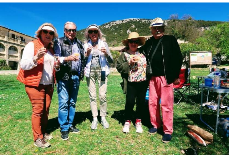
Apéritif de l'arrivée au Domaine des Courmettes