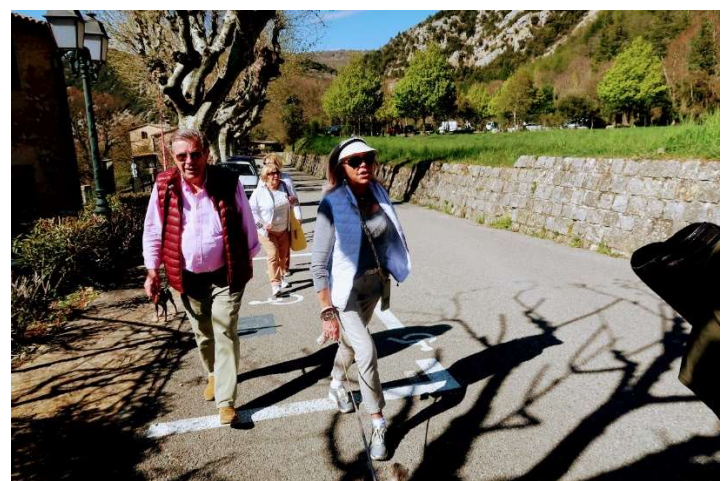
Rien de tel qu'une bonne marche !