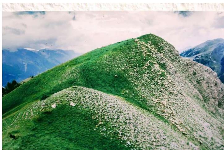
Pourtant, que la montagne est belle