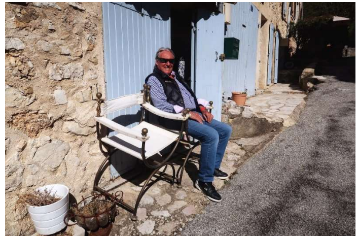
L'Imagier piégé !