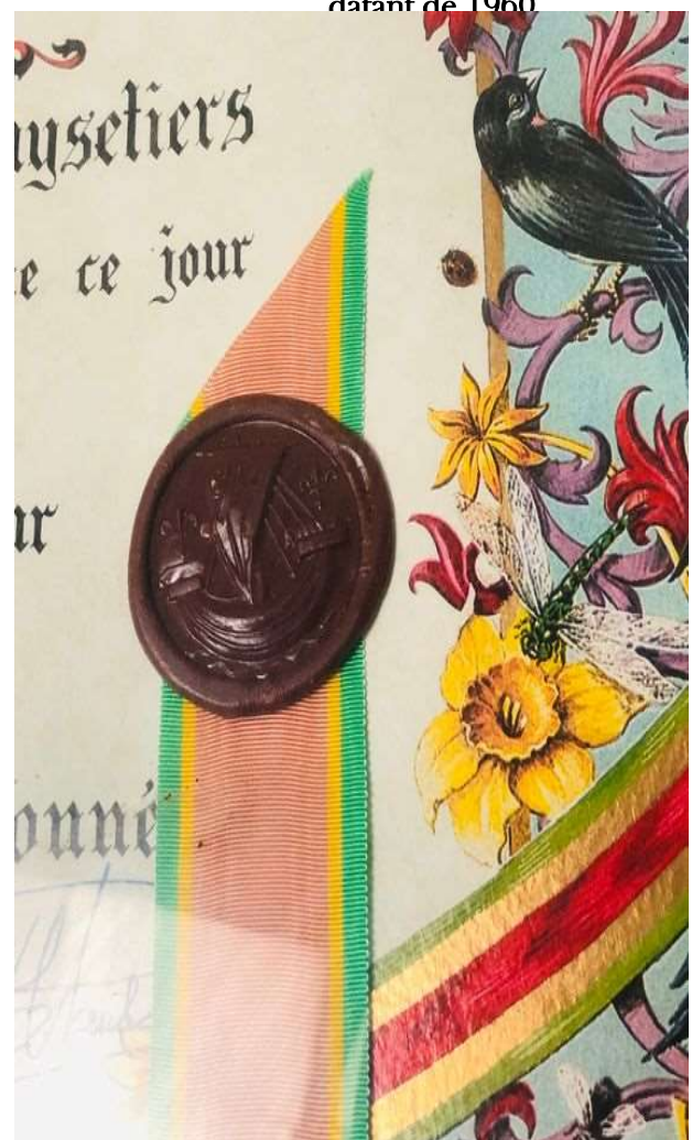
Diplôme de Maistre Anysetier datant de 1960