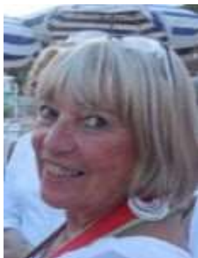
Grand Maistre sortant